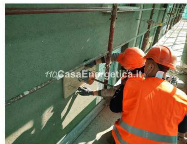
▲ Artigiani al lavoro in cantiere