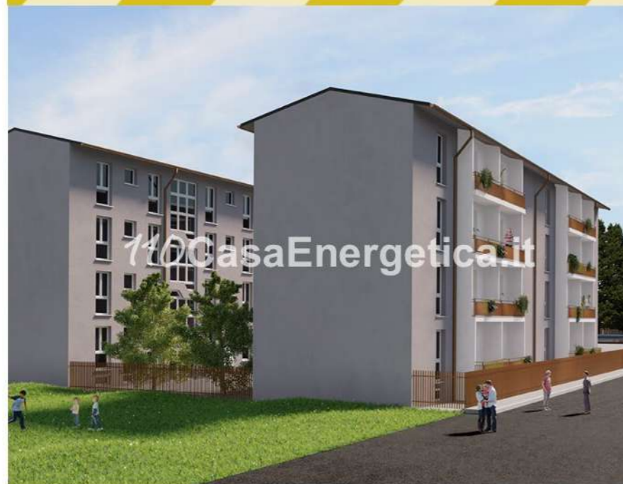
▲ Aspetto previsto post operam