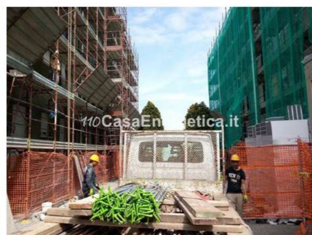
▲ Allestimento del cantiere